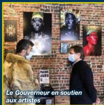
Le Gouverneur en soutien aux artistes