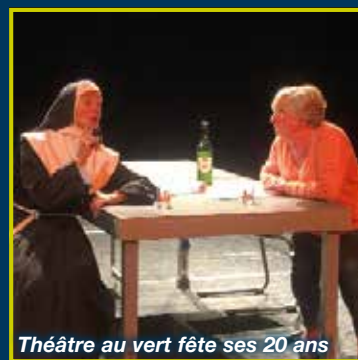
Théâtre au vert fête ses 20 ans

Bulletin officiel d'information de la Commune de Silly – Juin 2021