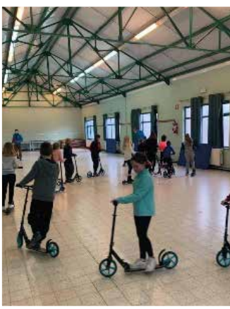
Initiation à la trottinette pour les élèves de nos écoles