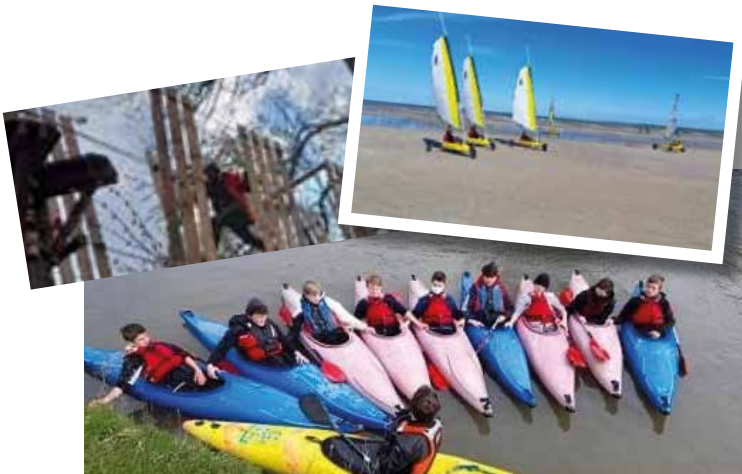
Stage de Pâques « Top Sports » pour les ados