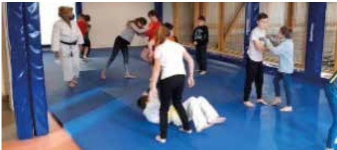
Stage multisports lors des congés de Carnaval