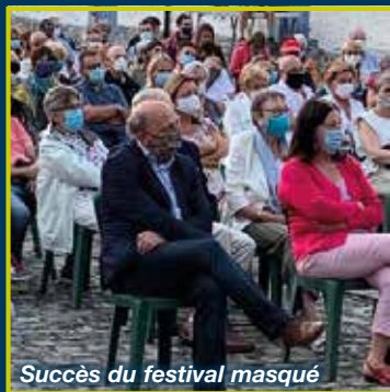
Succès du festival masqué