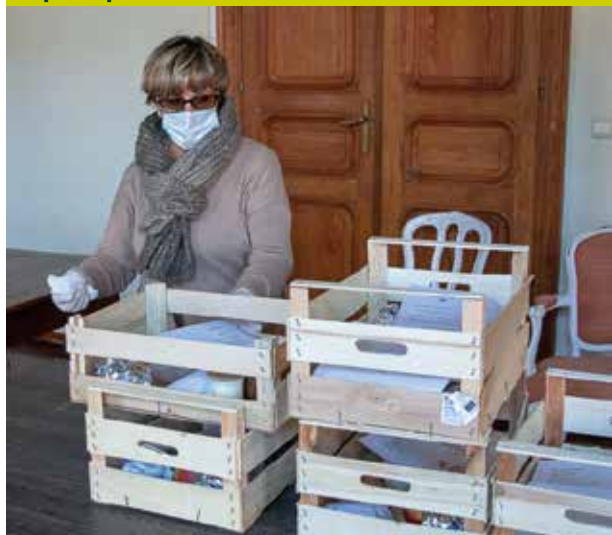
Silly-cooking – livraison de paniers repas pour les + de 60 ans de l'entité