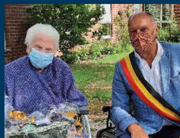
Une centenaire au home à Silly

Bulletin officiel d'information de la Commune de Silly – Septembre 2020