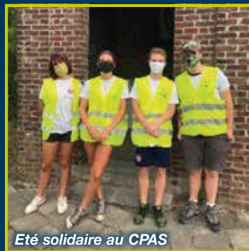
Eté solidaire au CPAS