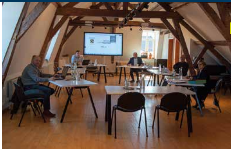
L'administration en mode Covid