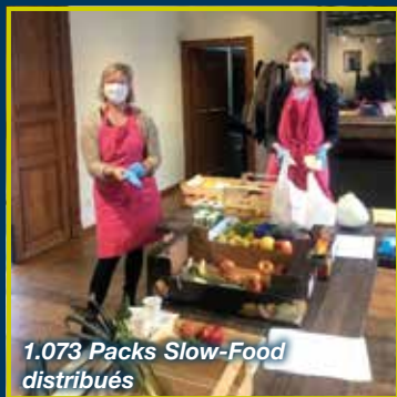
1.073 Packs Slow-Food distribués