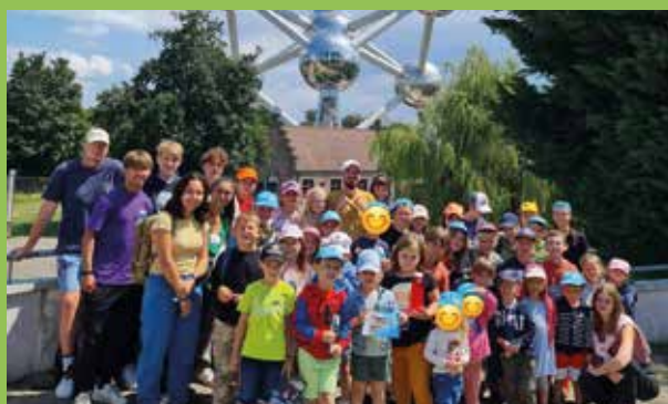
Sortie des plaines de vacances : visite à l'Atomium