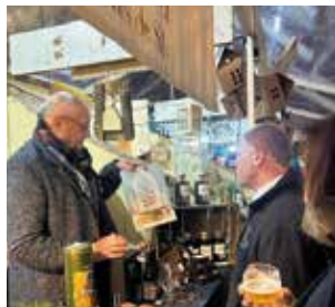
Avec l'Echevin du tourisme à San Miniato