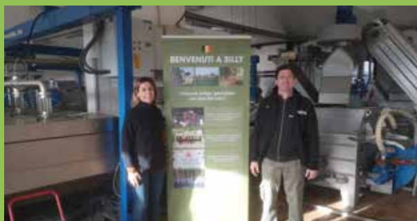
Silly... au cœur des producteurs d'huile d'olive