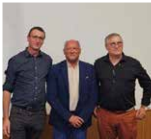
Avec les Maires de Troarn & Sannerville

Notre Commune a un potentiel extraordinaire. Son patrimoine vaut la peine d'être préservé et choyé. Je souhaite ainsi déposer sous votre sapin un cadeau qui profitera à tous. Le souhait suivant, écrit en lettres d'or, « Prends soin de Ta Commune ». Je vous souhaite de très belles fêtes. Soyez prudents sur les routes, pensez à ceux qui sont seuls.