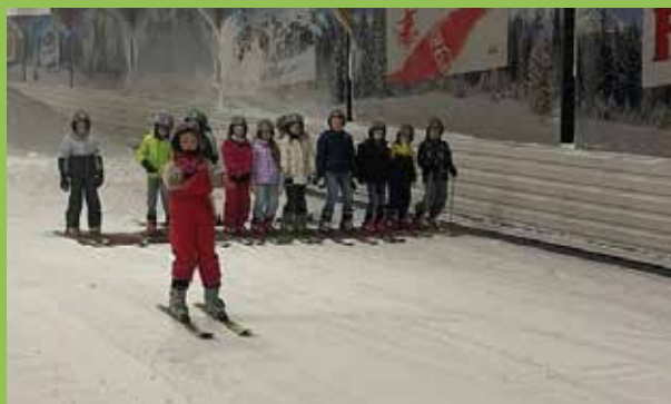
Stage Top sport