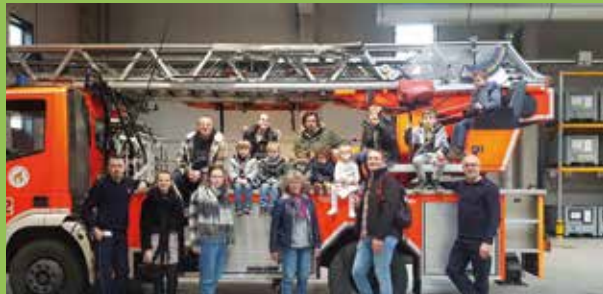
Activité intergénérationnelle : visite à la caserne des pompiers